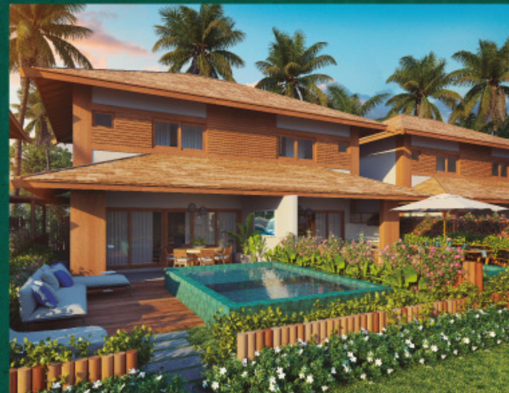
*Referente à unidade E09

3 SUÍTES • 144,21m 2 * Total de área privativa