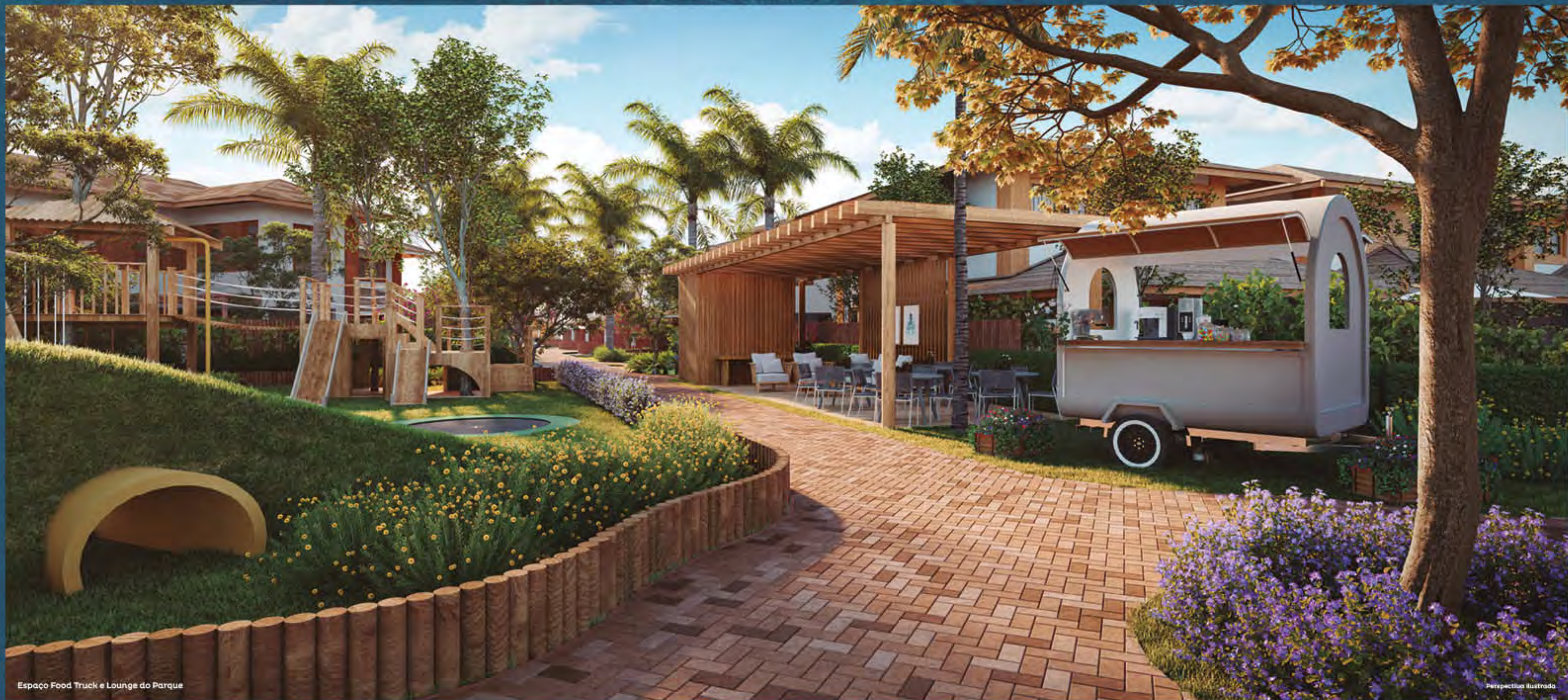
Espaço Food Truck e Lounge do Parque