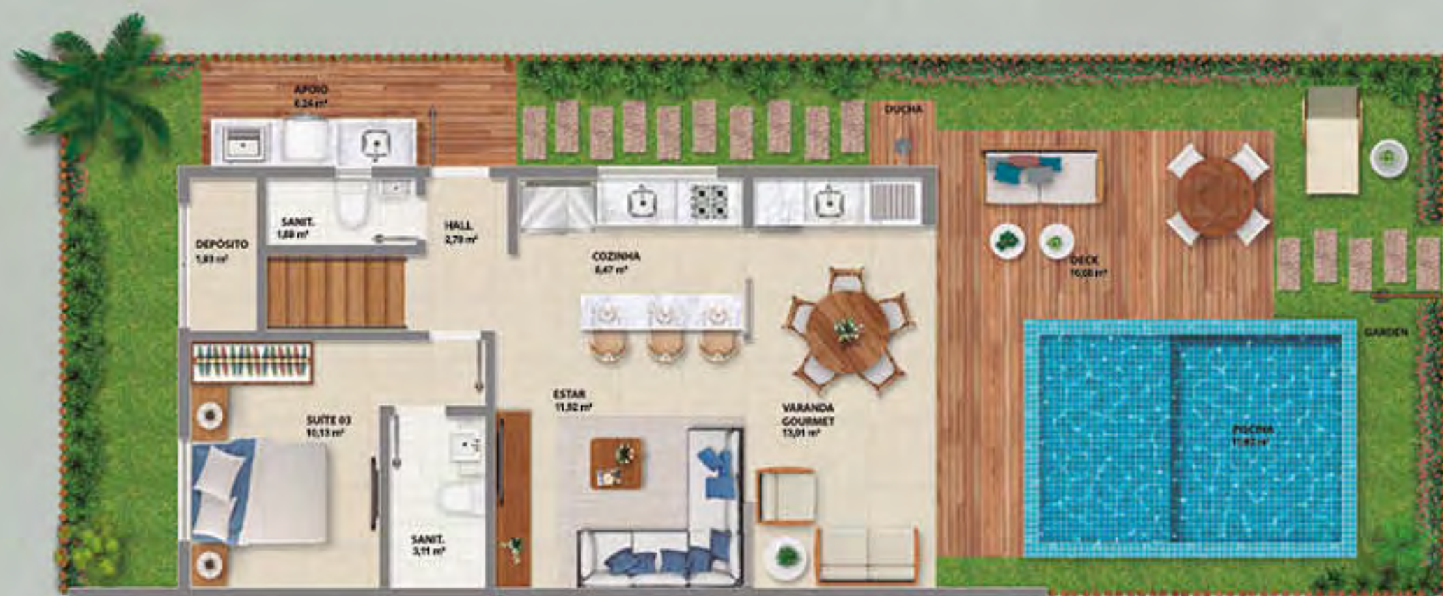
BANGALÔ DO JARDIM • PISO INFERIOR