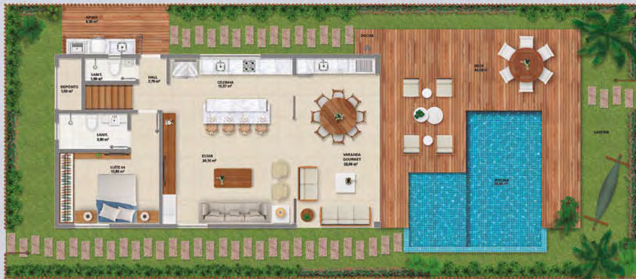
BANGALÔ DA PRAIA • PISO INFERIOR