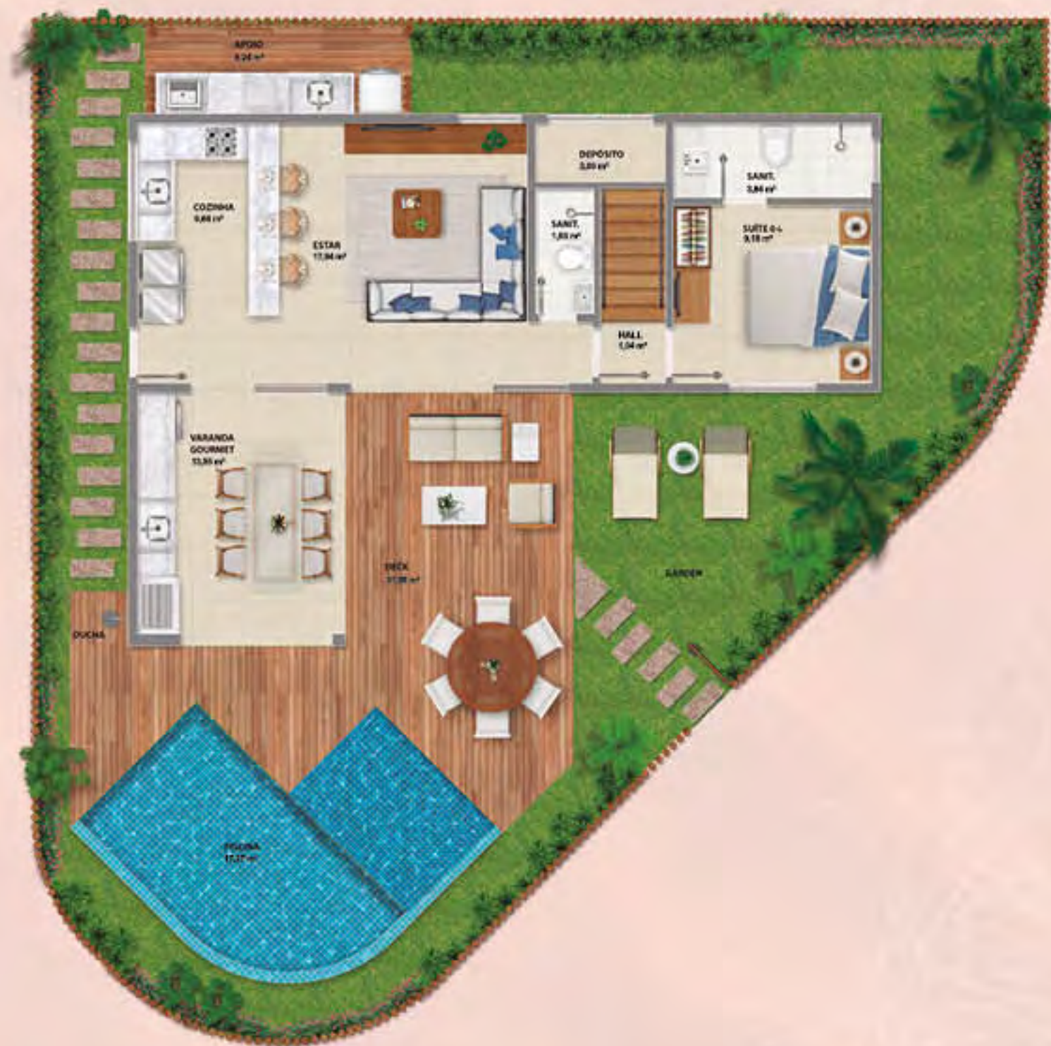
BANGALÔ DO PARQUE • PISO INFERIOR