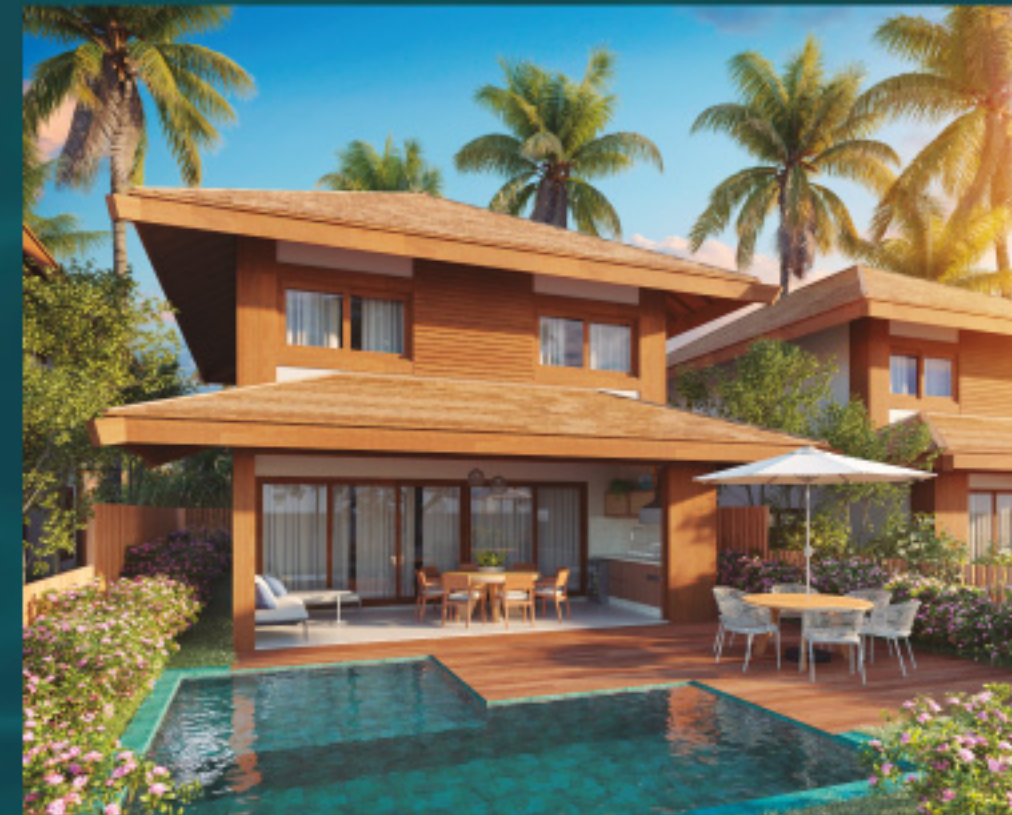
*Referente à unidade B02

4 SUÍTES • 200,82m 2 * Total de área privativa