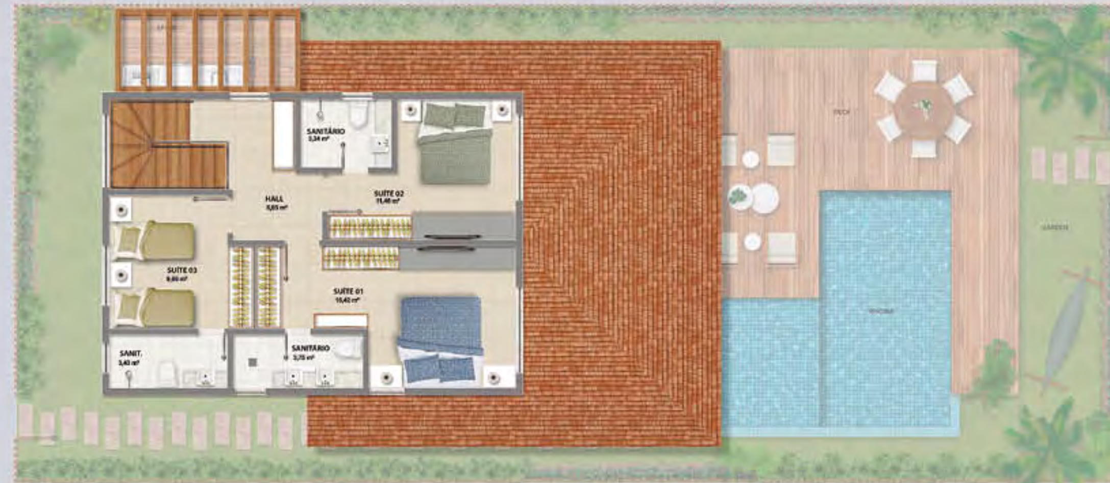
BANGALÔ DA PRAIA • PISO SUPERIOR