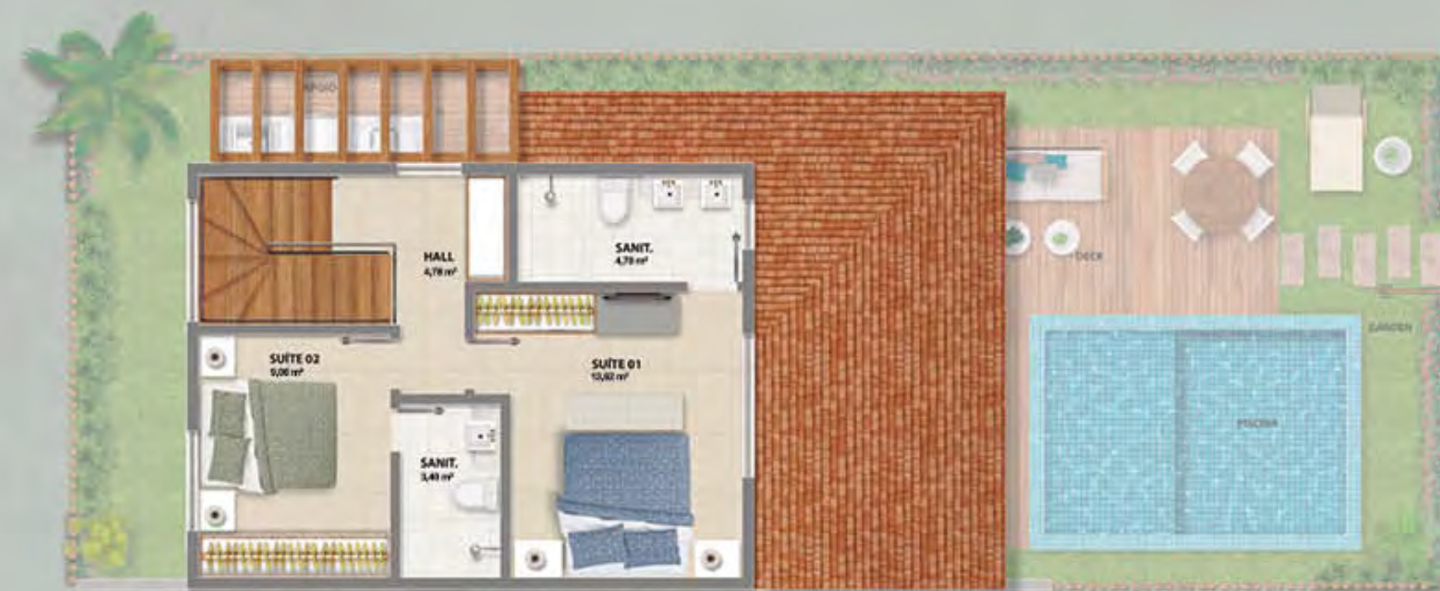
BANGALÔ DO JARDIM • PISO SUPERIOR