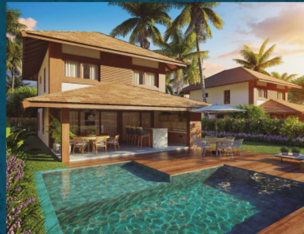
*Referente à unidade A01

4 SUÍTES • 239,59m 2 * Total de área privativa