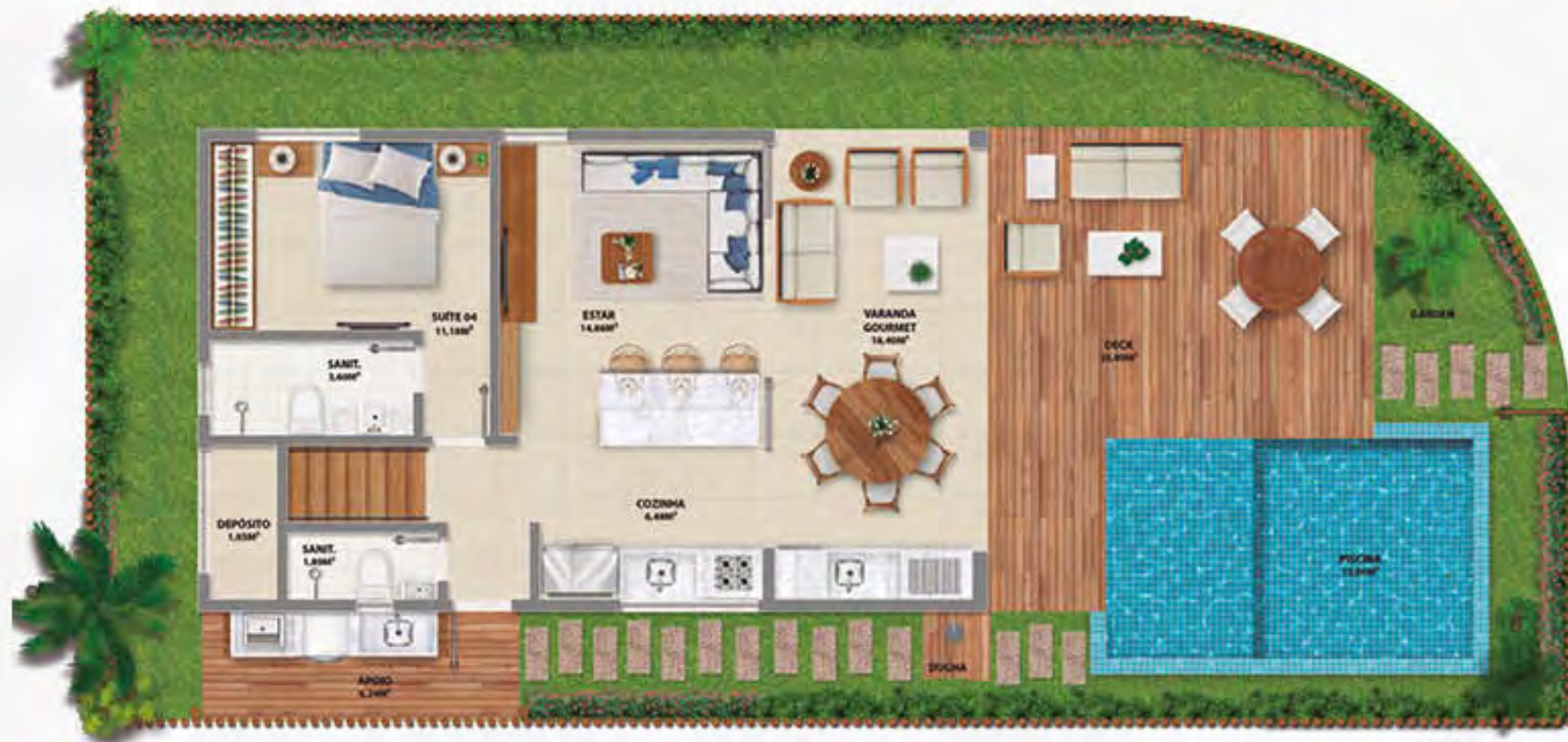
BANGALÔ DO MAR/LUÁ • PISO INFERIOR