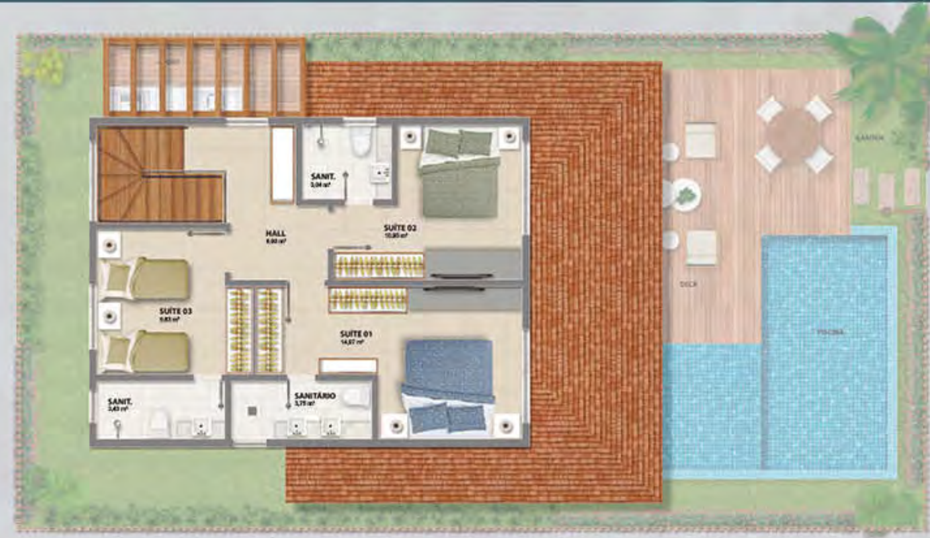
BANGALÔ DA ESPERA • PISO INFERIOR