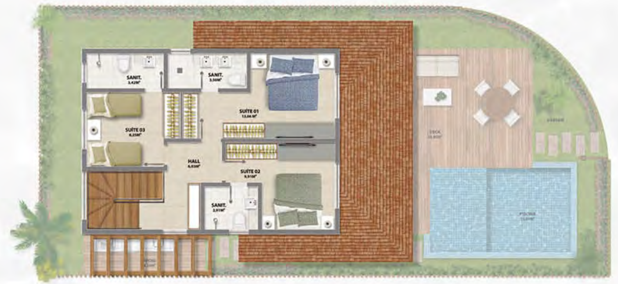
BANGALÔ DO MAR/LUÁ • PISO SUPERIOR