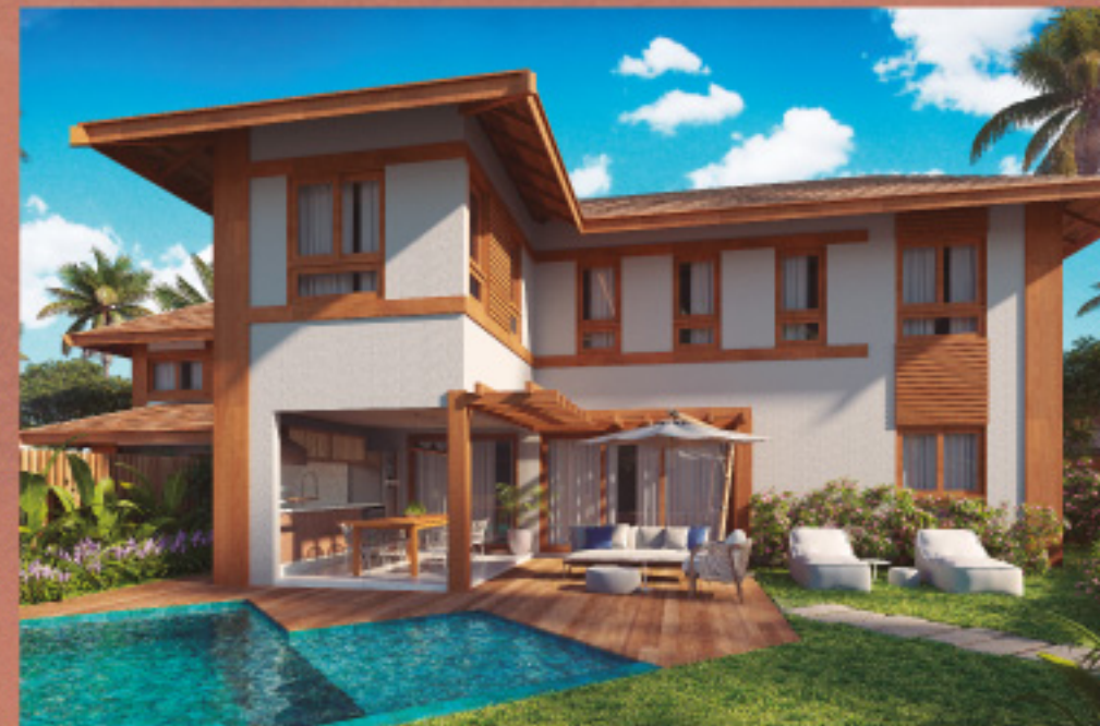
*Referente à unidade C01

4 SUÍTES • 196,85m 2 * Total de área privativa