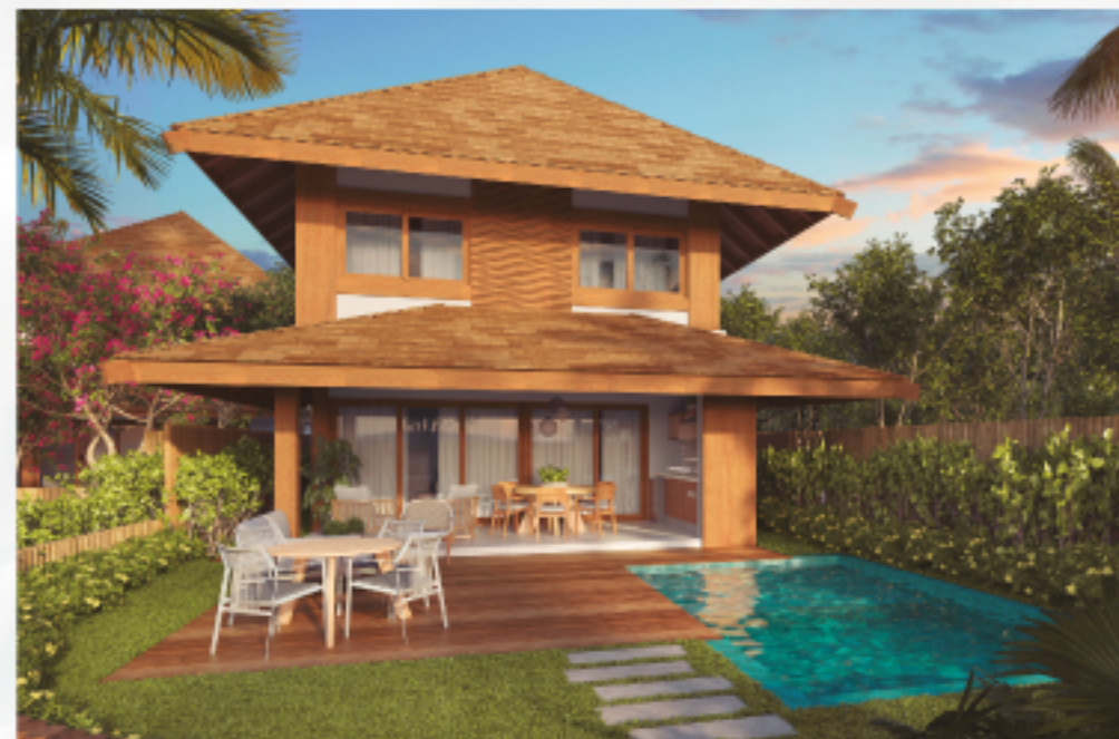
*Referente à unidade C08

4 SUÍTES • 180,21m 2 * Total de área privativa