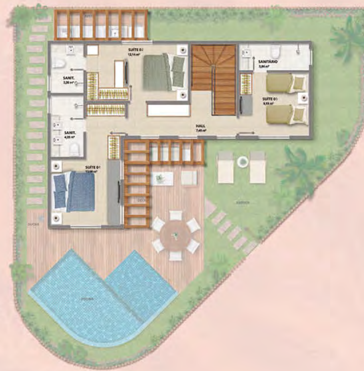
BANGALÔ DO PARQUE • PISO SUPERIOR