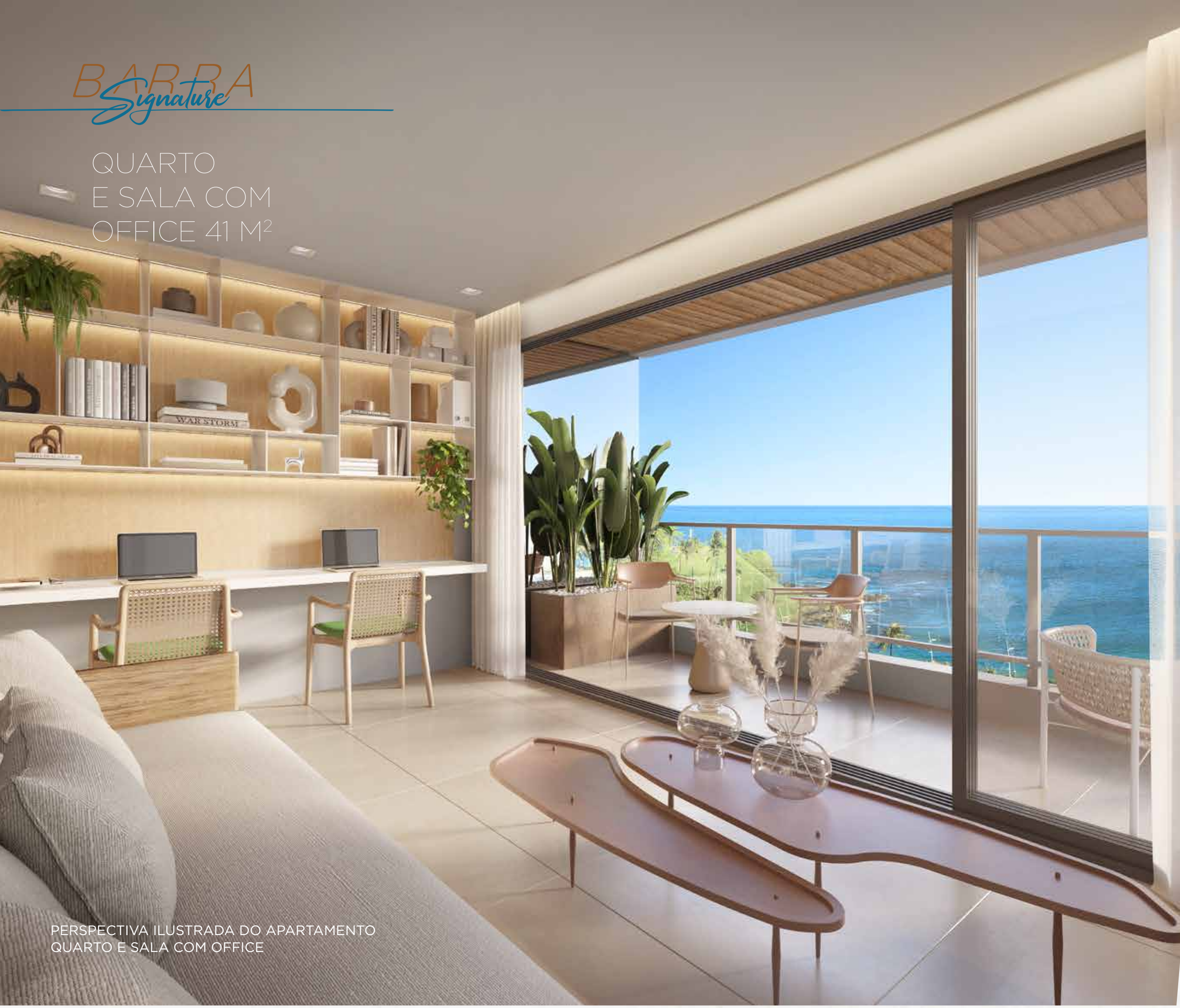
PERSPECTIVA ILUSTRADA DO APARTAMENTO QUARTO E SALA COM OFFICE