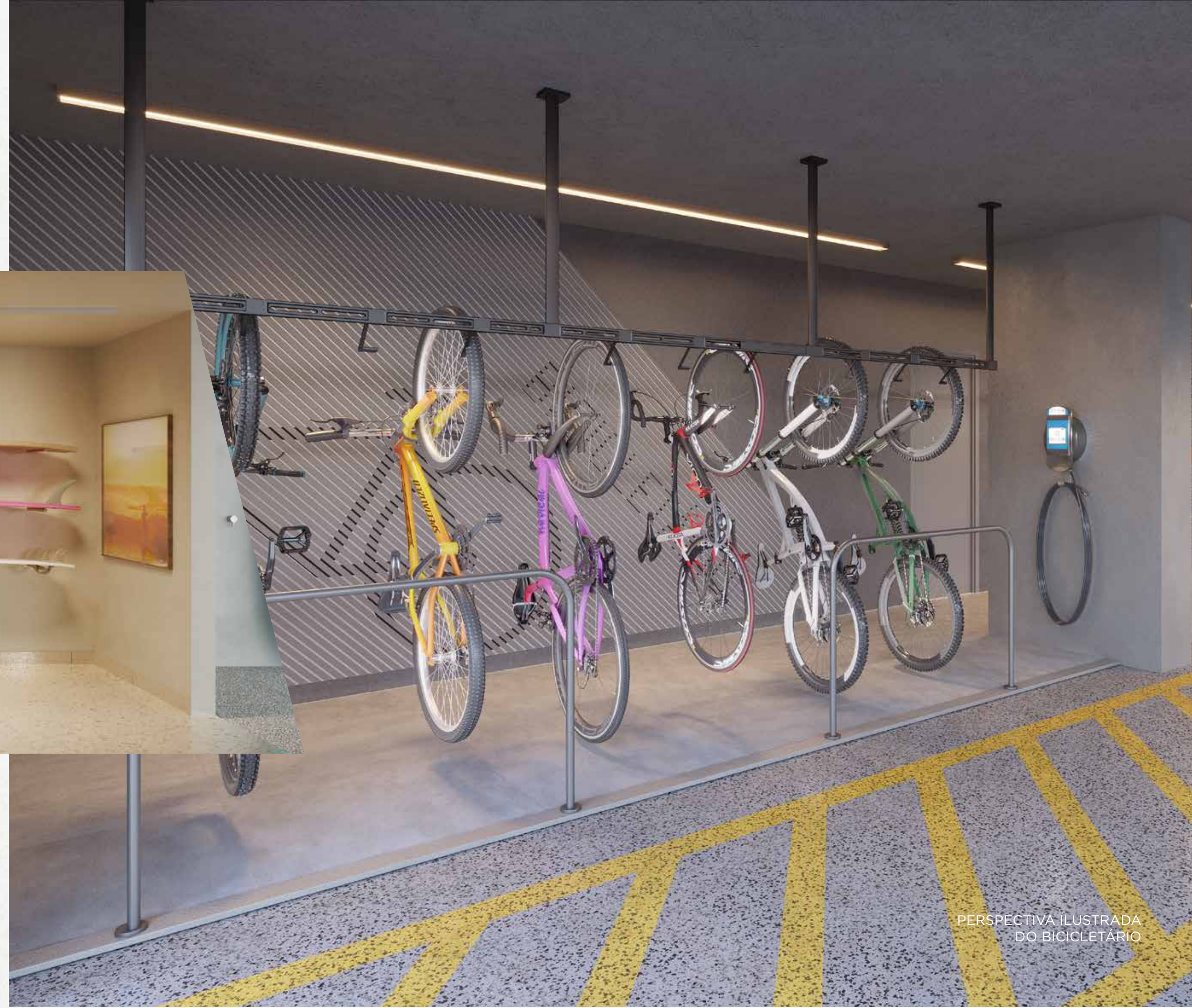
PERSPECTIVA ILUSTRADA DO BICICLETÁRIO