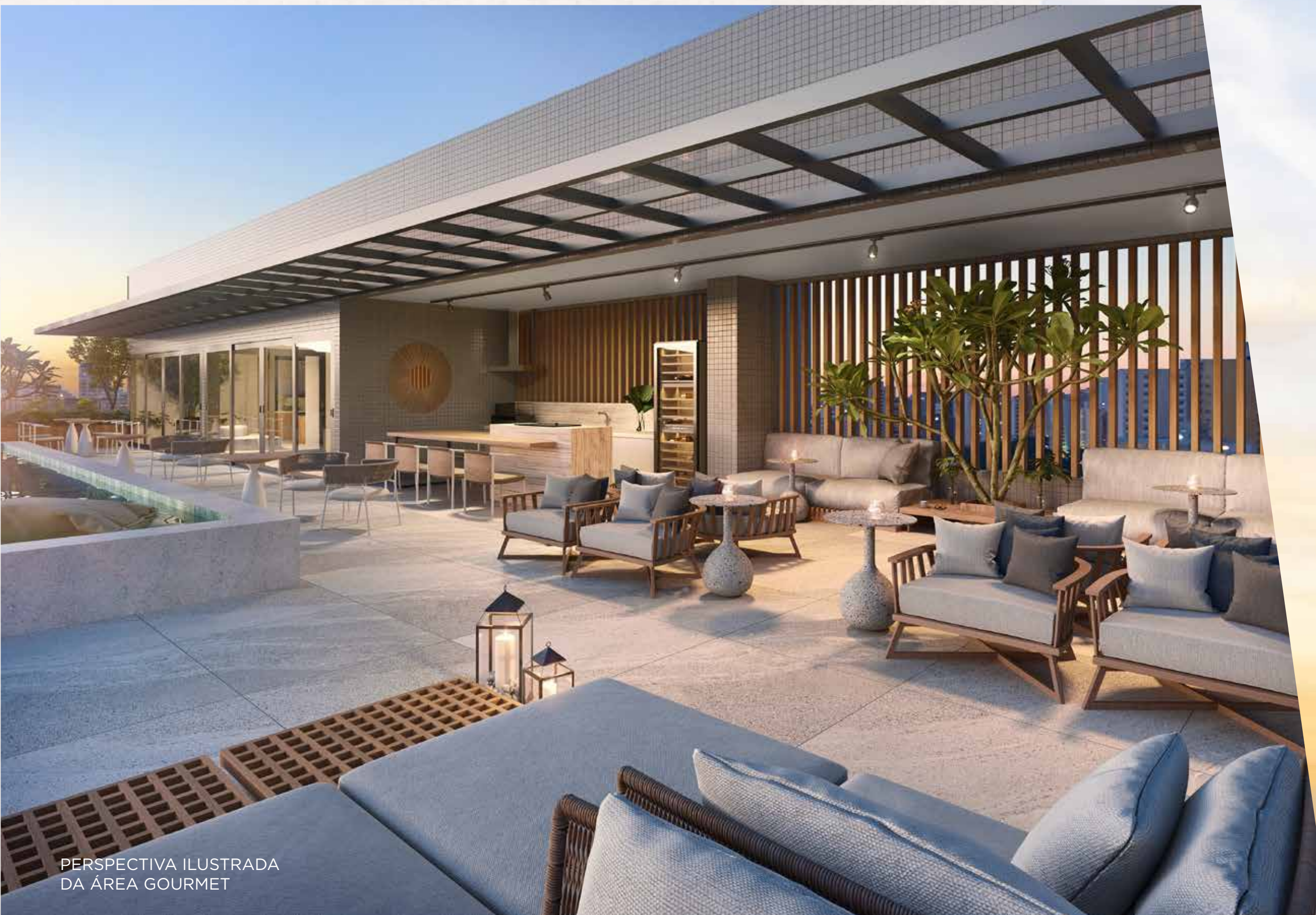
PERSPECTIVA ILUSTRADA DA ÁREA GOURMET