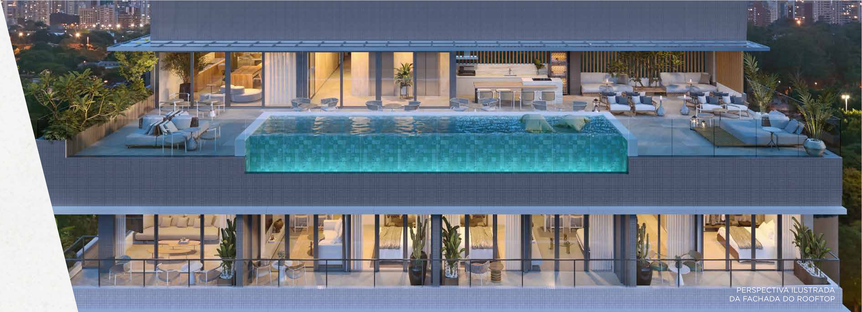
PERSPECTIVA ILUSTRADA DA FACHADA DO ROOFTOP