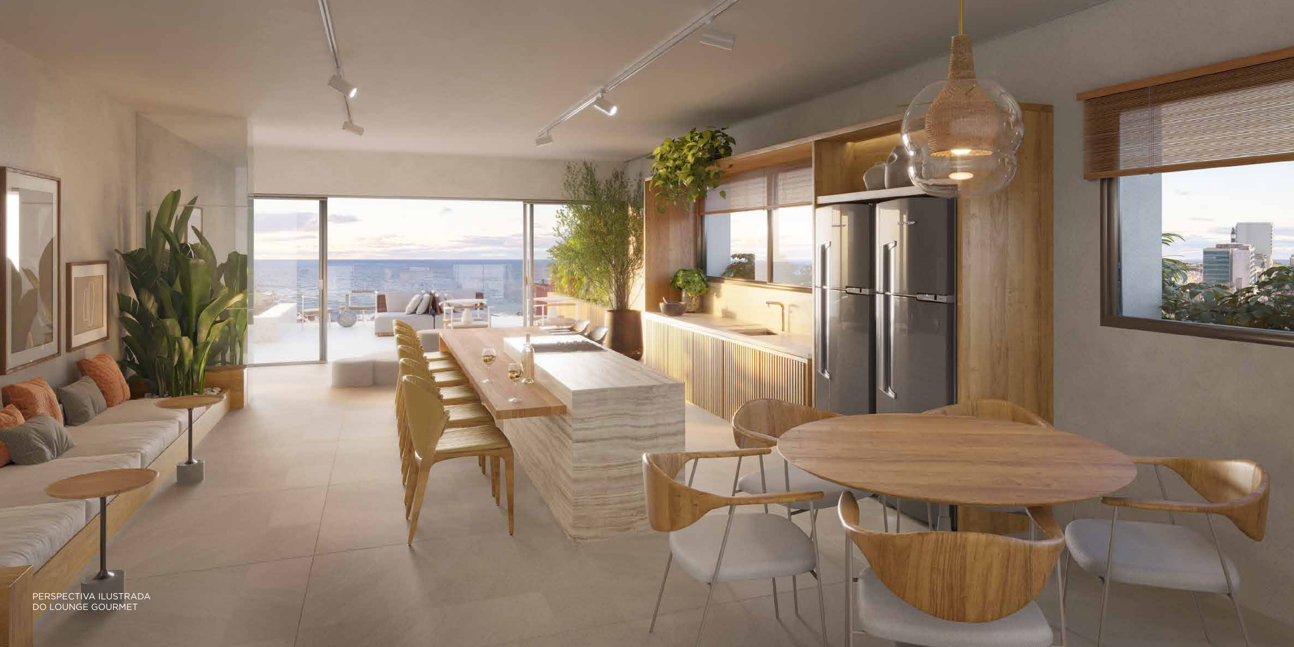
PERSPECTIVA ILUSTRADA DO LOUNGE GOURMET