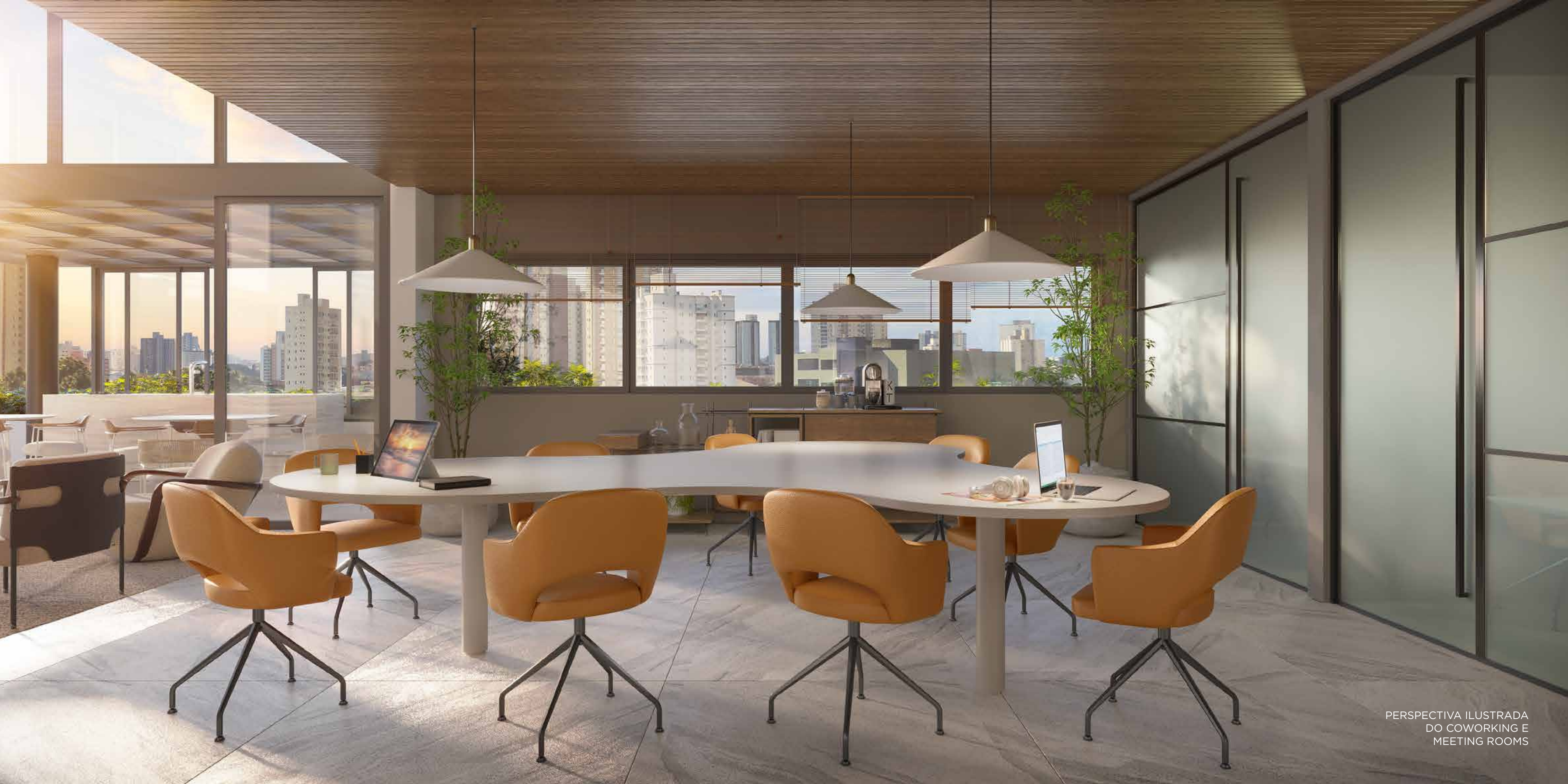
PERSPECTIVA ILUSTRADA DO COWORKING E MEETING ROOMS