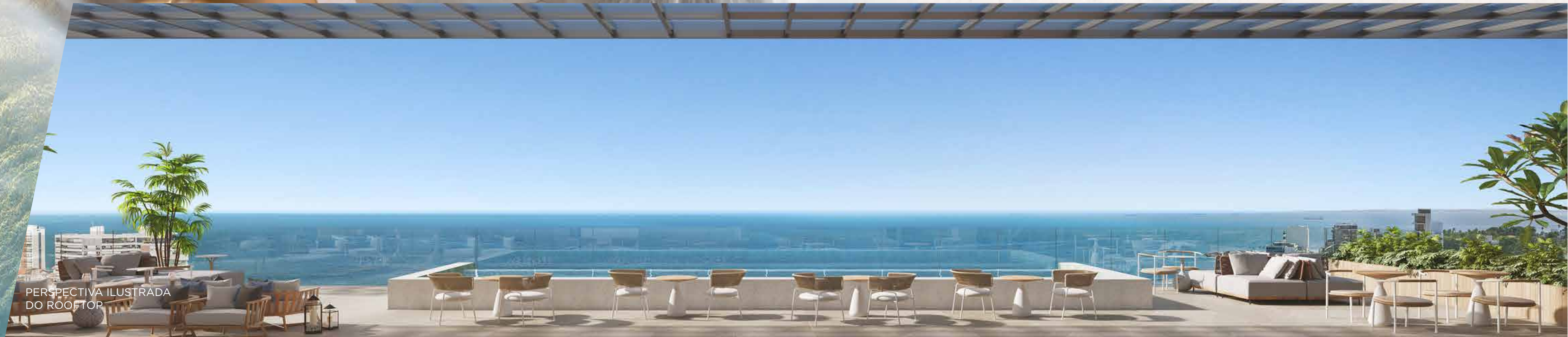
PERSPECTIVA ILUSTRADA DO ROOFTOP