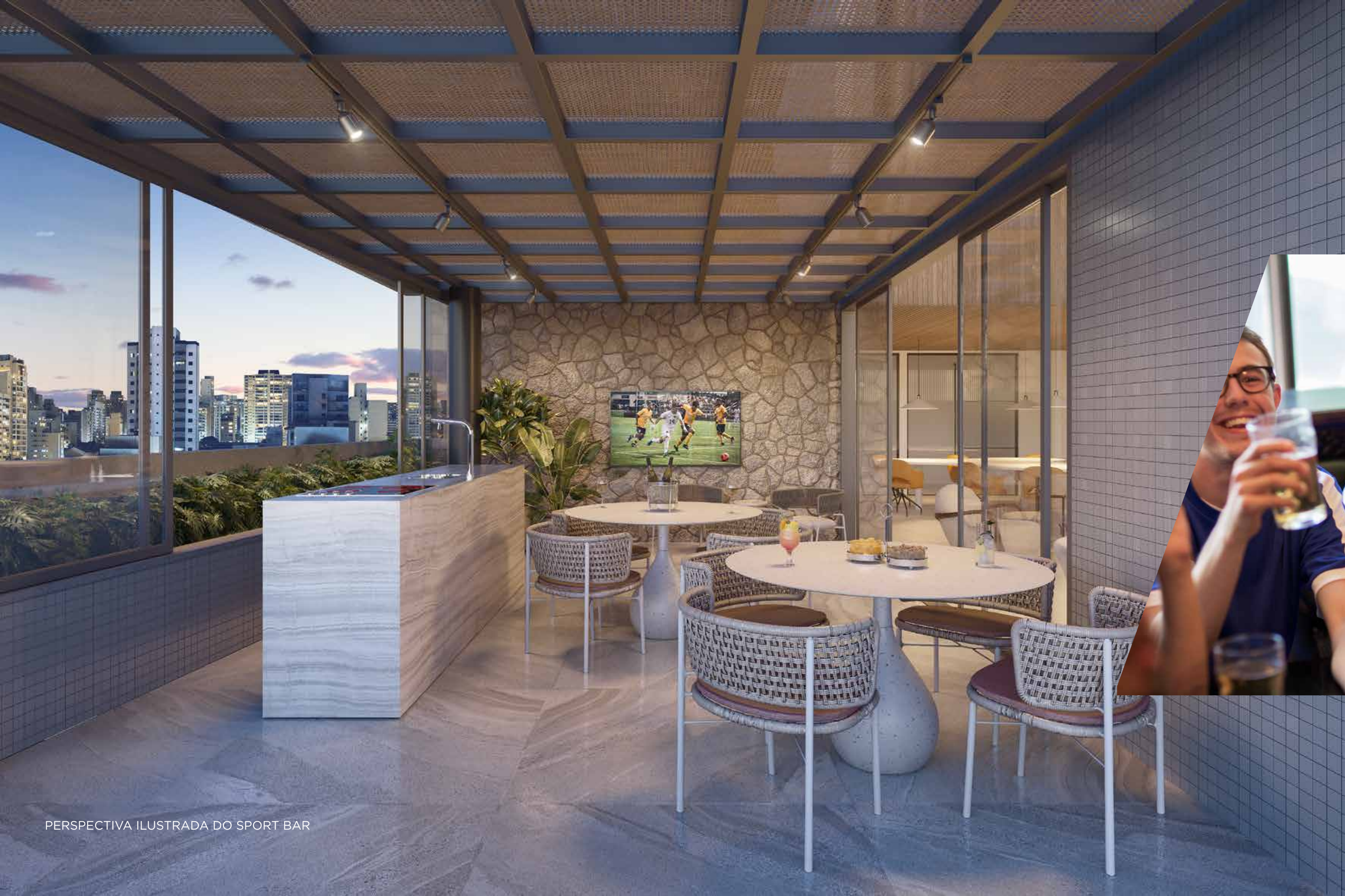
PERSPECTIVA ILUSTRADA DO SPORT BAR