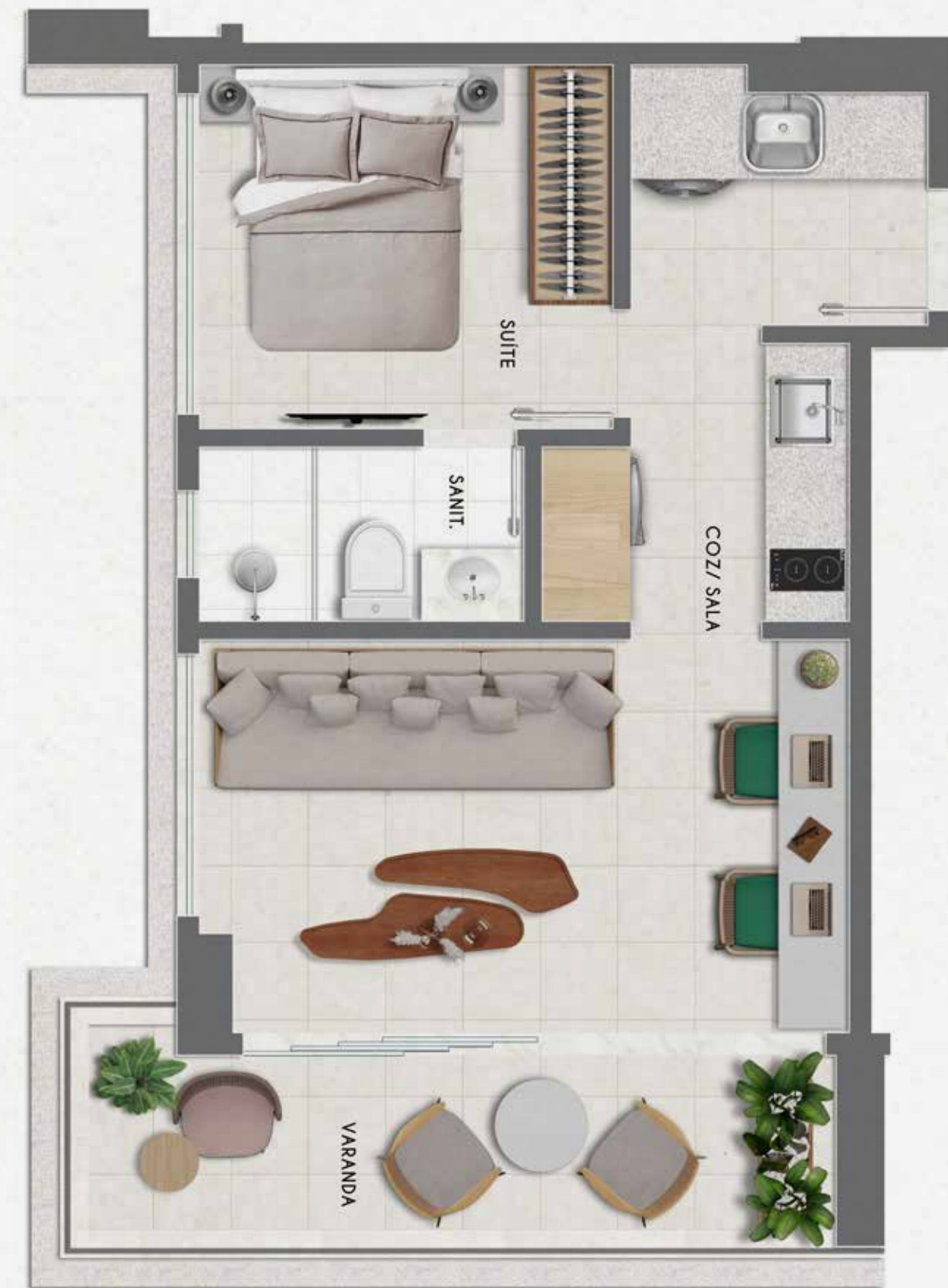
QUARTO E SALA COM OFFICE 41 M 2