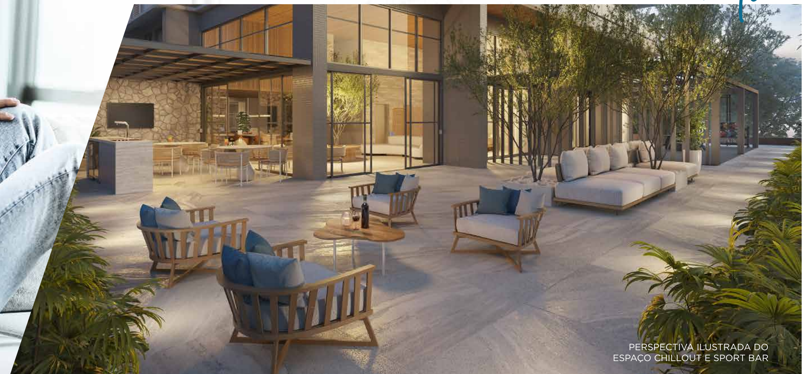
PERSPECTIVA ILUSTRADA DO ESPAÇO CHILLOUT E SPORT BAR

Ambientes integrados com total harmonia e atenção especial a cada detalhe.