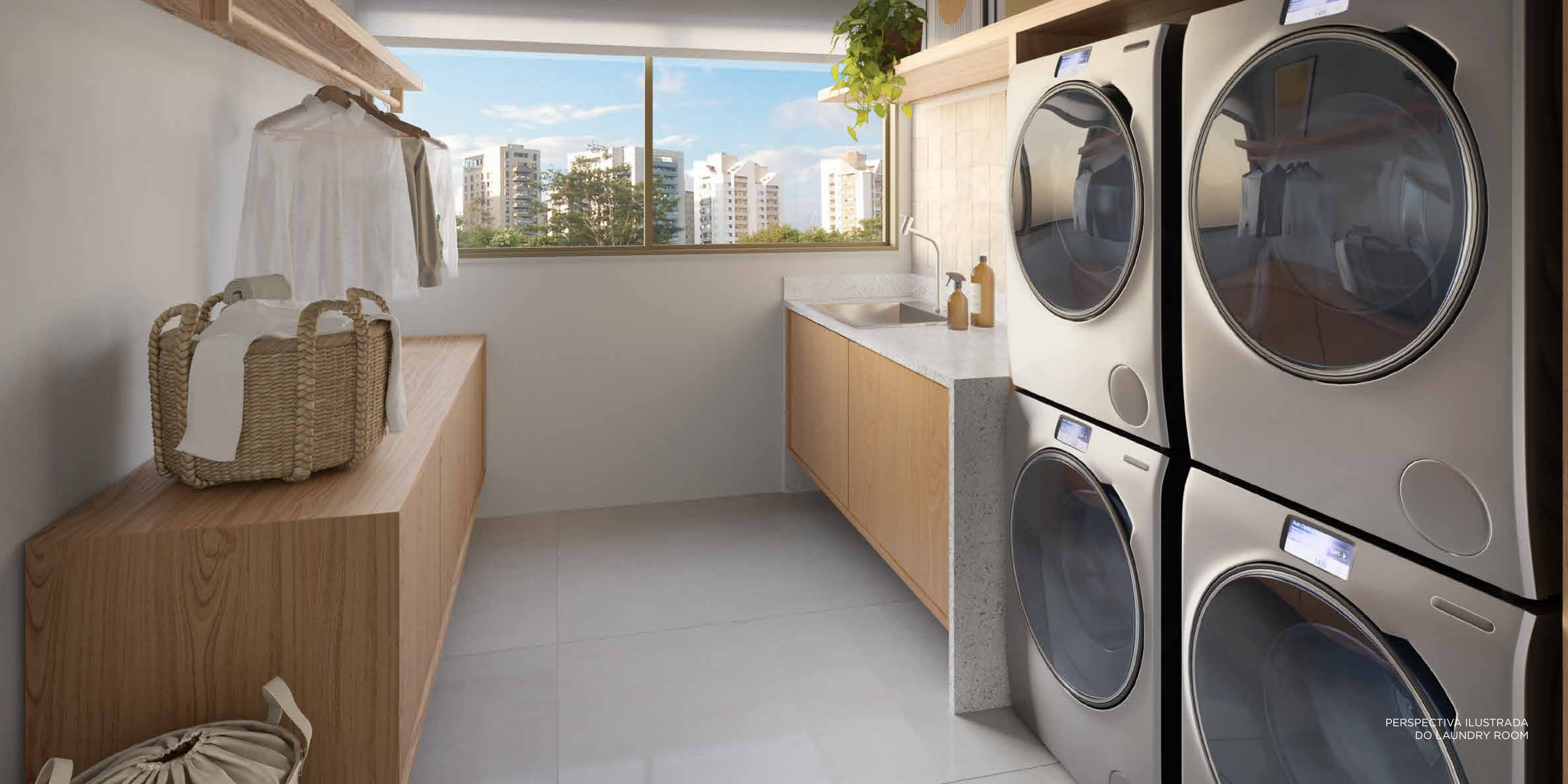
PERSPECTIVA ILUSTRADA DO LAUNDRY ROOM