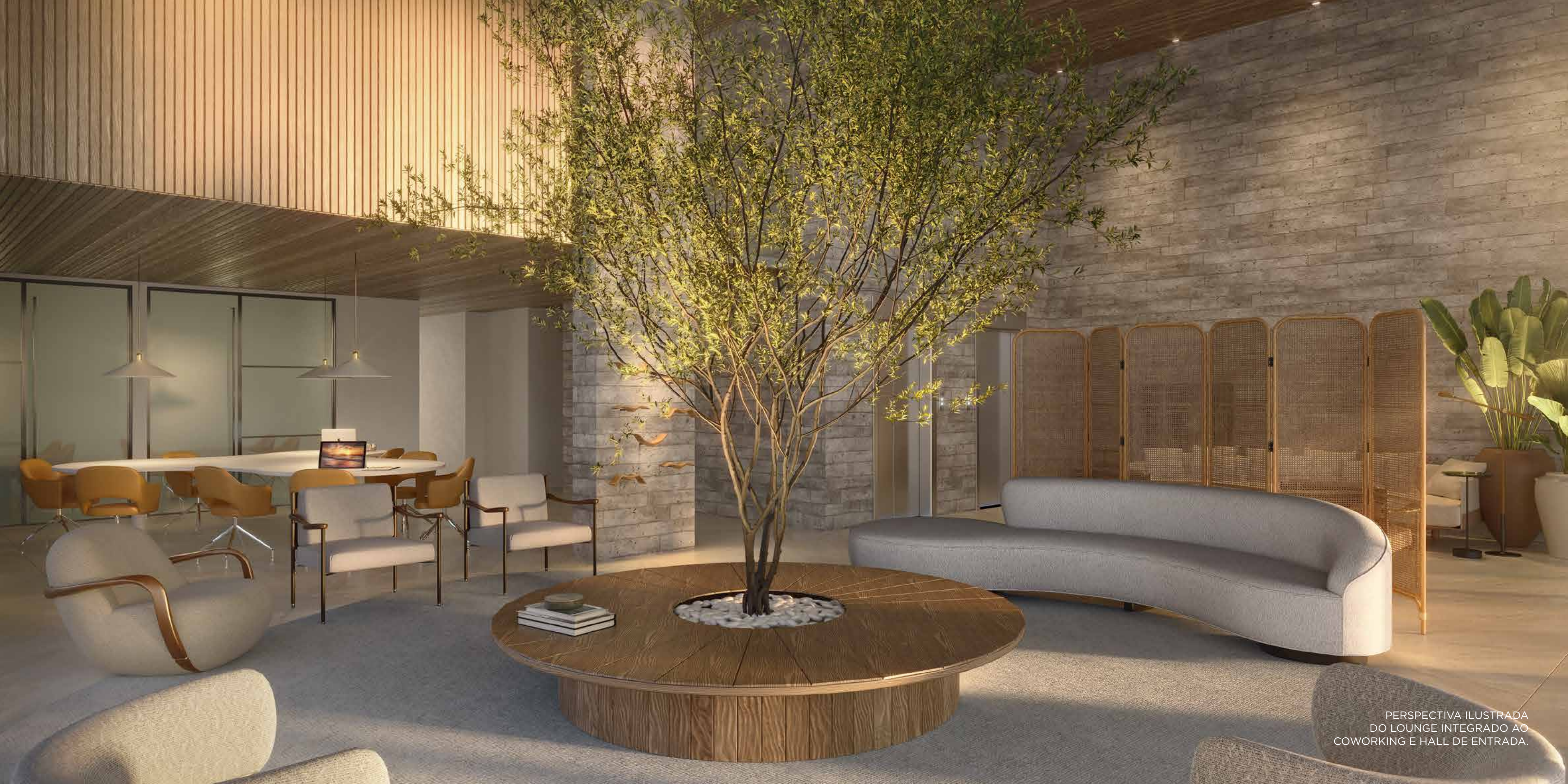
PERSPECTIVA ILUSTRADA DO LOUNGE INTEGRADO AO COWORKING E HALL DE ENTRADA.