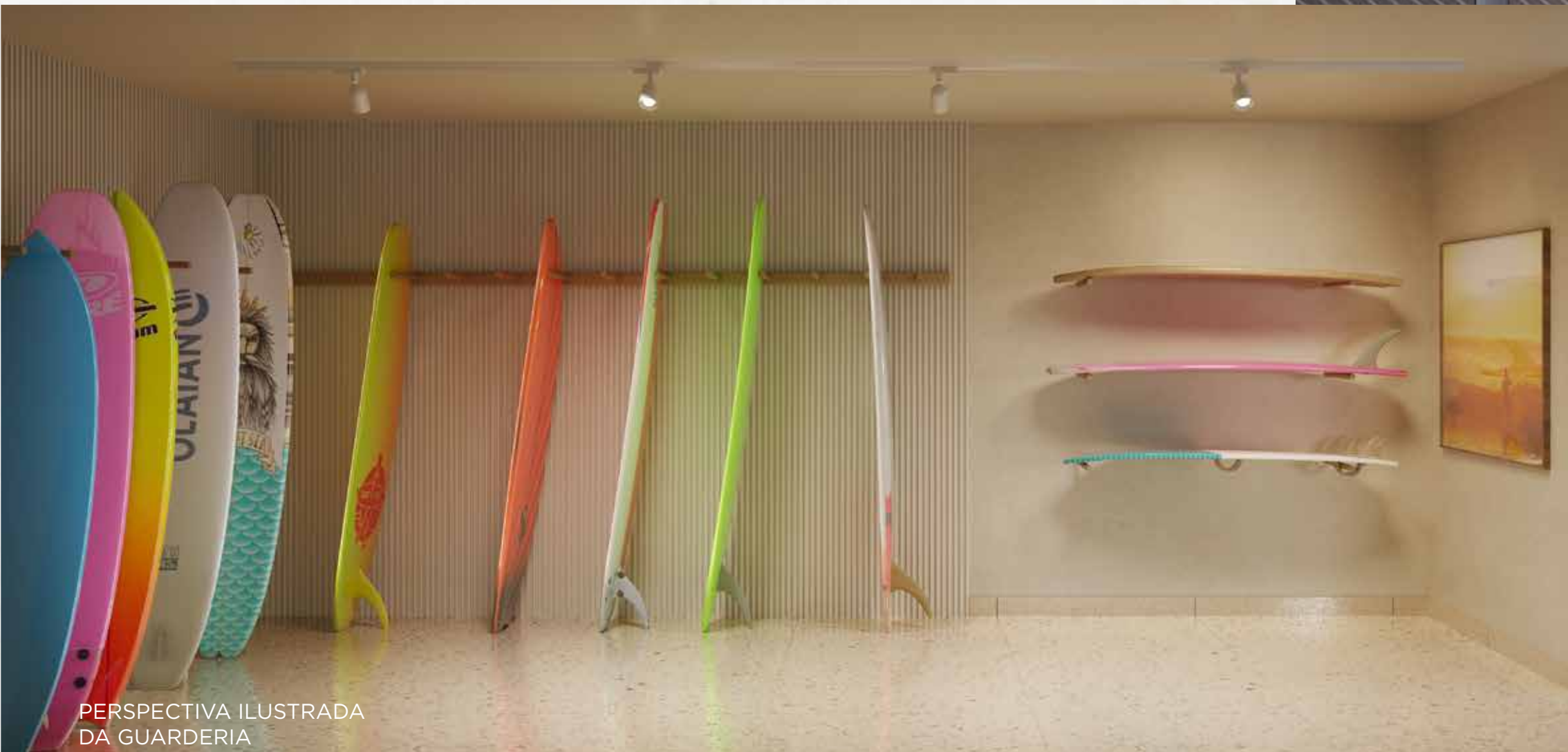
PERSPECTIVA ILUSTRADA DA GUARDERIA