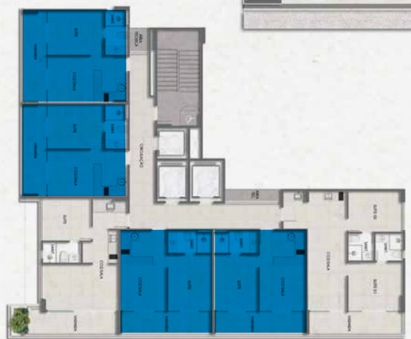
QUARTO E SALA 35 M 2