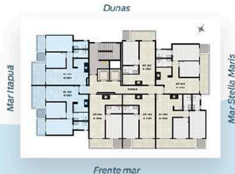
Planta Tipo 1