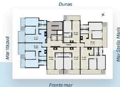
Planta Tipo 1