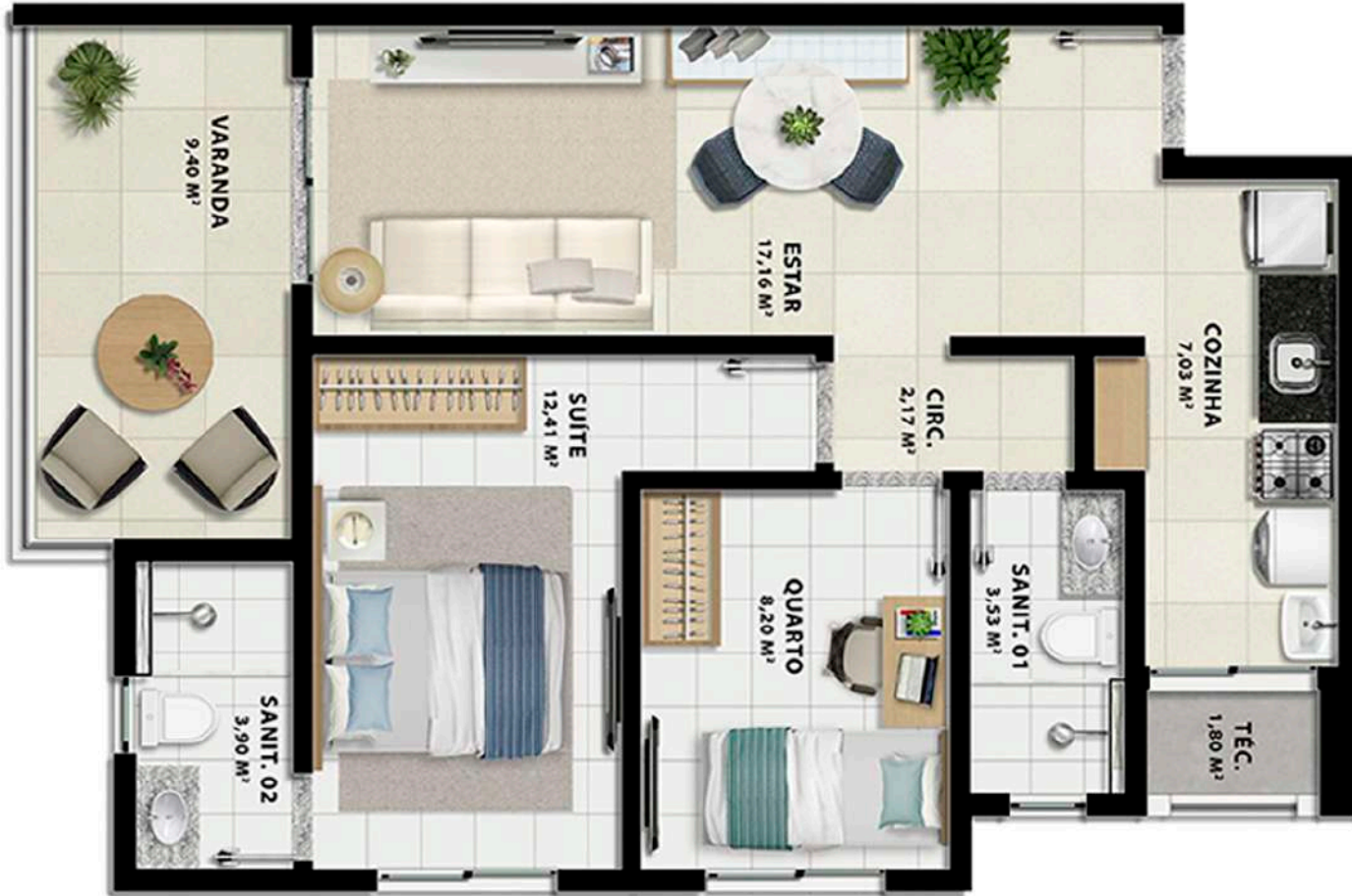
Planta Tipo 2