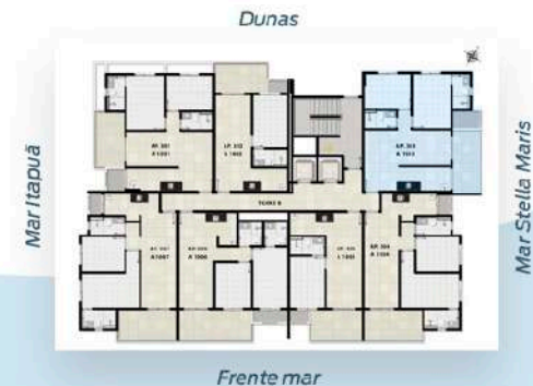
Planta Tipo 3