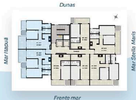
Planta Tipo 1