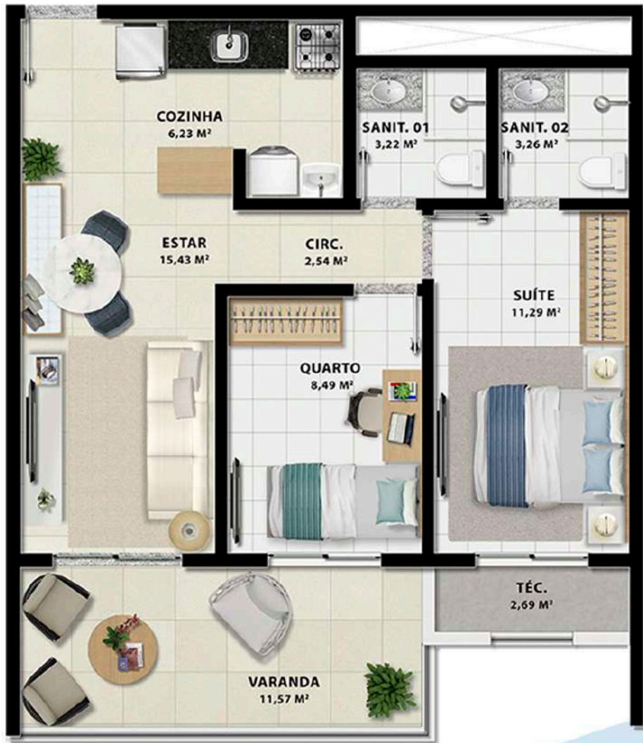
Planta Tipo 1