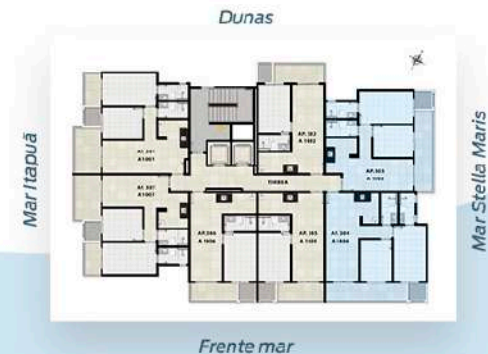
Planta Tipo 2