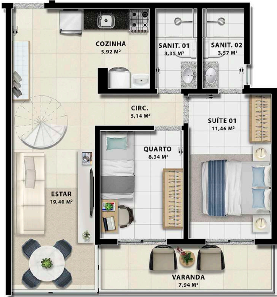
Planta Tipo 2