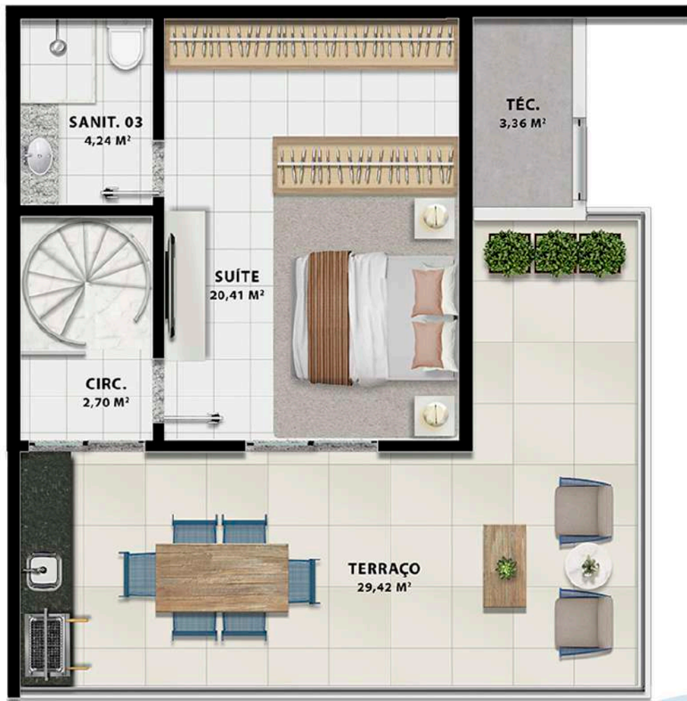
Planta Tipo 2